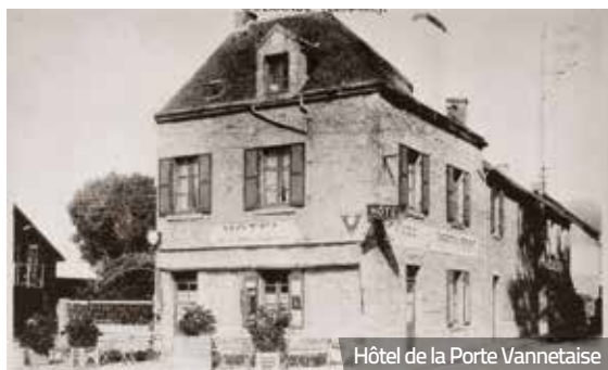
Hôtel de la Porte Vannetaise