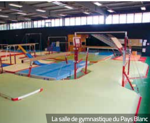
La salle de gymnastique du Pays Blanc

Parce que la municipalité ne peut pas systématiquement réaliser des équipements neufs, il est primordial d'effectuer une veille sur l'ensemble des infrastructures existantes afin de garantir aux usagers un confort d'utilisation.