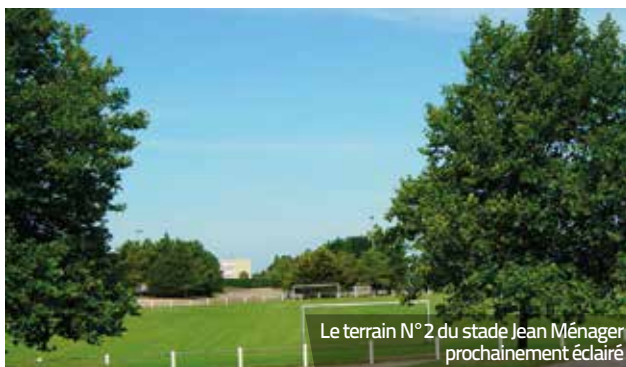
Le terrain N° 2 du stade Jean Ménager prochainement éclairé

La couverture des deux terrains de tennis extérieurs de Bréhadour est évidemment le projet phare de cette année. Malgré tout, d'autres travaux sont planifiés.