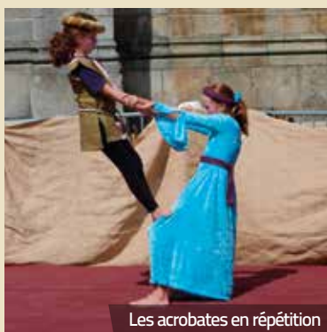
Les acrobates en répétition