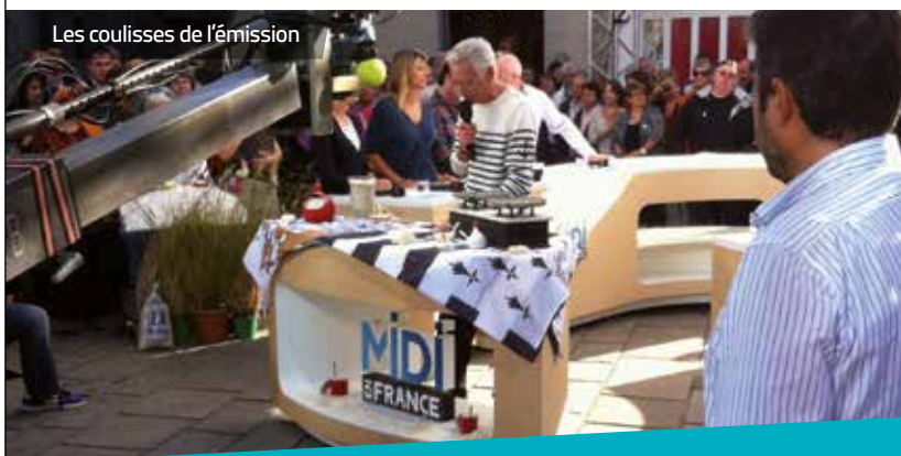
Les coulisses de l'émission

En amont, durant la première semaine de septembre, une série de reportages avaient été tournés afin d'être diffusés au cours des cinq émissions. Guérande, en tant que ville hôte, a eu la part belle avec des reportages sur son patrimoine naturel (les marais salants), et architectural (les remparts). De nombreux curieux ont pu assister aux coulisses du tournage de ces émissions et apprécier l'organisation nécessaire au bon déroulement de ce type de programme télévisé d'envergure. Guérande restera la première ville de Loire-Atlantique à avoir été choisie par la direction de France 3 pour son émission "Midi en France". Toutes les vidéos sont disponibles sur le site www.ville-guerande.fr .