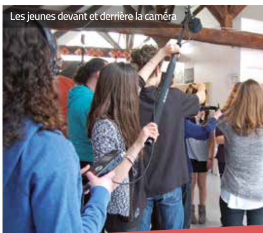
Les jeunes devant et derrière la caméra

Le Conseil intercommunal de sécurité et de prévention de la délinquance (CISPD) et trois collèges et lycées du territoire (dont les lycées Galilée et Olivier Guichard pour Guérande), ont collaboré à un projet de courts-métrages autour du thème de la prévention des conduites à risque. Créés par et pour les jeunes, ces sujets ont été