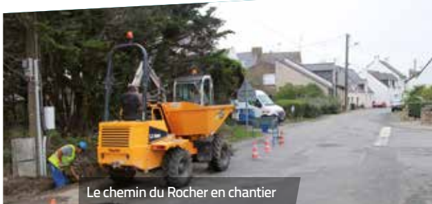
Le chemin du Rocher en chantier