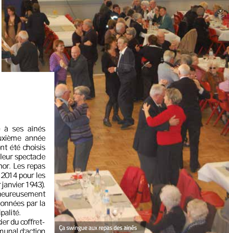
Ça swingue aux repas des aînés

La remise des coffrets-cadeaux s'effectuera au CCAS, sur présentation du coupon, jeudi 6 et vendredi 7 février 2014 de 10h à 12h et de 14h 30 à 16h 30.