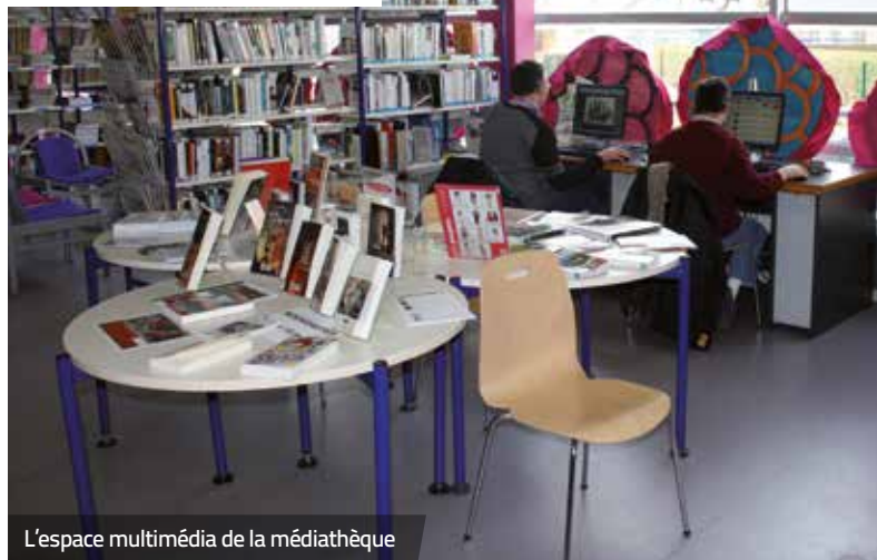
L'espace multimédia de la médiathèque

*mardi: 15h - 19h ; mercredi et samedi: 10h - 12h 30 et 13h 30 - 18h ; jeudi et vendredi : 15h - 18h