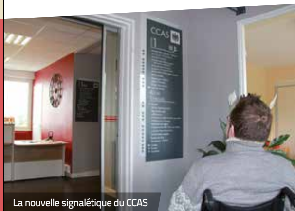
La nouvelle signalétique du CCAS