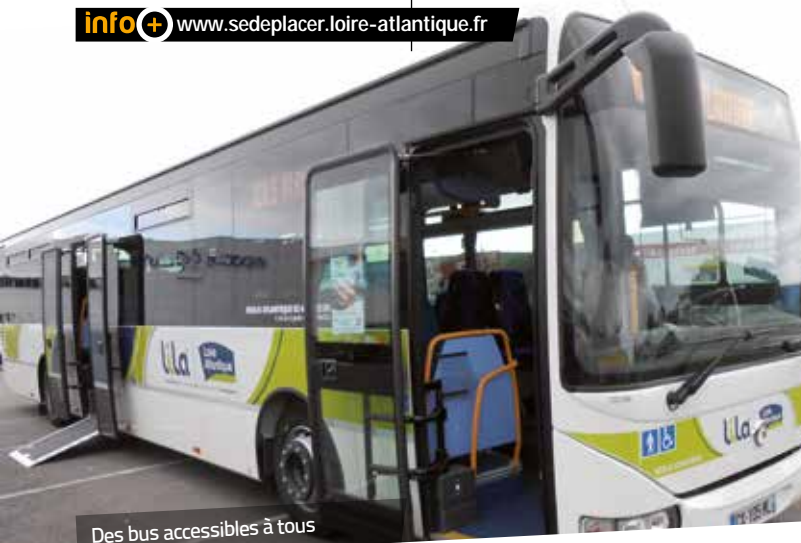
Des bus accessibles à tous

info+ www.sedeplacer.loire-atlantique.fr