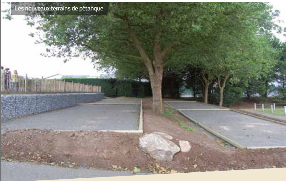
Les nouveaux terrains de pétanque