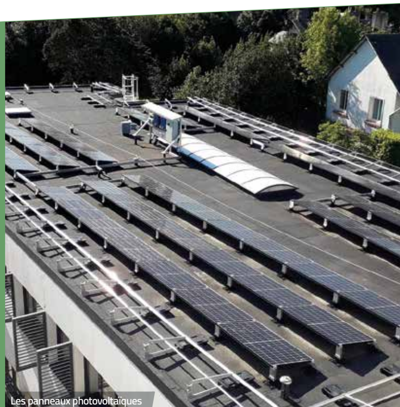
Les panneaux photovoltaïques

En effet, 69 panneaux photovoltaïques d'une puissance de 21 kWc sont installés sur les 115 m 2 du toit-terrace. En service depuis l'année dernière, ils ont permis de produire environ 11 Mwh de janvier à mai 2021, l'équivalent énergétique de 77 000 kilomètres de route en Renault Zoé ou des besoins annuels de 2 logements RT2012 de 100 m 2 .