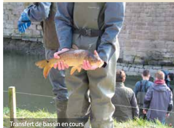
Transfert de bassin en cours

Vous avez peut-être vu une drôle d'opération se dérouler autour des remparts de Guérande au printemps ? Il s'agissait des élèves du lycée professionnel Olivier Guichard qui récupéraient les poissons des douves ! En effet, une partie des douves a été vidée pour les travaux et les élèves de la filière piscicole se sont chargés de faire passer les poissons d'un bassin à l'autre.