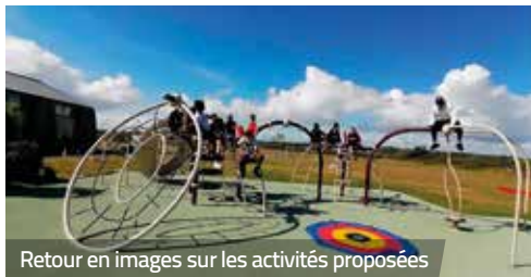
Retour en images sur les activités proposées