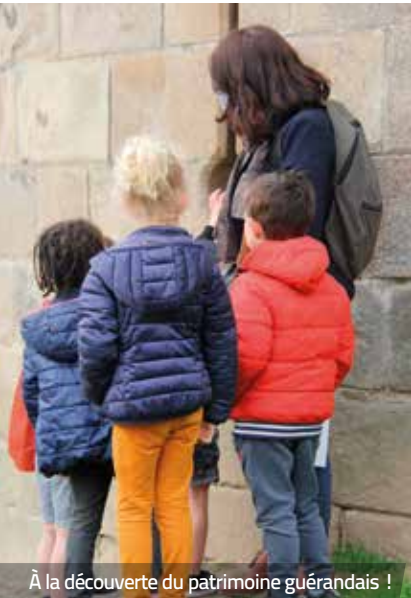
À la découverte du patrimoine guérandais !

Avez-vous aperçu le 31 mars dernier, devant les halles, des enfants en train de recréer l'ambiance du marché ? Il s'agissait du centre de loisirs en pleine mise en scène ! 28 volontaires ont testé deux nouveautés créées par l'École des Arts et du Patrimoine et le pôle médiation de l'Office de Tourisme Intercommunal. « Les défis de Guérande », est un jeu en équipe pour les 7-12 ans permettant de s'immerger dans la cité grâce à des défis : questions sur le patrimoine, mise en scène, expérience sensorielle, etc. Les 3-6 ans participent quant à eux à « Guérande au temps des chevaliers », un rallye photo qui se termine sur le chemin de ronde. Baptisées LUDIK', ces prestations visent à rendre