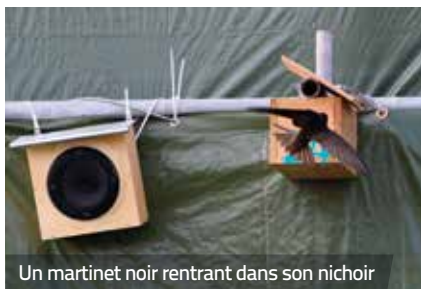
Un martinet noir rentrant dans son nichoir

Guérande, Ville d'art et d'histoire, a lancé depuis quelques années un vaste programme de restauration de ses monuments historiques. Dans ce cadre, des travaux de restauration se déroulent jusqu'au mois d'octobre sur la courtine d'une centaine de mètres de la porte Vannetaise à la tour de Kerbenet. Il s'agit avant tout de renforcer cette partie de la muraille, grâce à la dévégétalisation