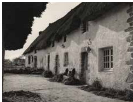
L'aventure guérandaise de Gustave Tiffoche commence en 1963, dans une ancienne ferme du 18 e siècle couverte de chaume, au lieu-dit Le Petit Poissevin situé en limite de Brière.

L'exposition Gustave Tiffoche, potier-sculpteur (1963-1990) présentée à la Porte Saint-Michel - Musée de Guérande sera l'occasion de montrer quelques œuvres remarquables parmi la production de cet artiste libre et généreux : pièces décoratives, sculptures, maquettes d'architecture, documents d'archives, photographies. La visite de l'exposition permettra au jeune public, comme aux moins jeunes, d'appréhender les différentes étapes de leur fabrication et de découvrir les mystères du grès.