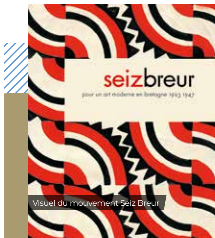
Visuel du mouvement Seiz Breur